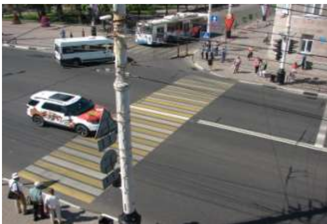
Вид из окна кабинета № 117, корпуса № 1