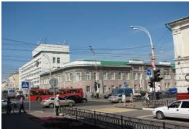
Вид от музыкального института им. Рахманинова