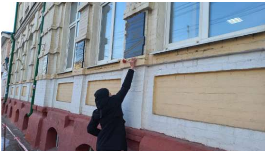
Возложение цветов к мемориальным доскам Героев

С 15 февраля в лицее стартовал цикл мероприятий, посвященных памятным датам – Дню тамбовских героев, и 80-летию со дня присвоения З.А. Космодемьянской звания Героя СССР. В программе мероприятий запланированы классные часы, тематическая выставка в музее военно-исторической славы выпускников школы и партизан-тамбовцев, библиотечные уроки, экскурсия с возложением цветов к мемориальным доскам Героев и памятнику Зои Космодемьянской.